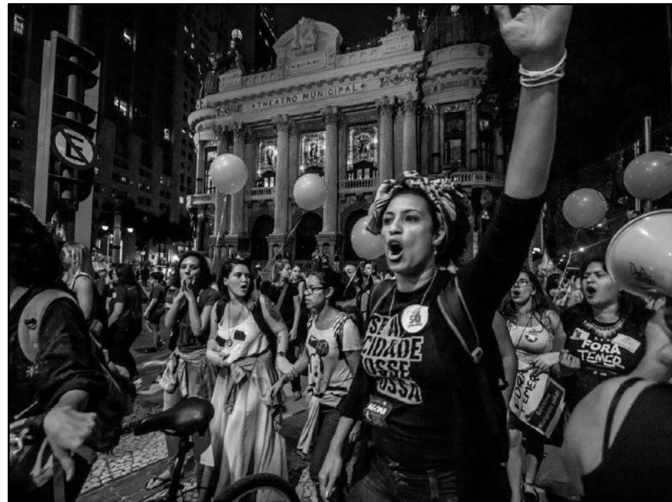
Figura 1 – Marielle Franco em manifestação ao direito à cidade

favelada, socióloga e política brasileira, que foi executada brutalmente no dia 14 de março do ano de 2018 com a idade de 38 anos, na cidade do Rio de Janeiro, junto de seu motorista, Anderson Pedro Gomes, aos 39 anos de idade (ROCHA, 2019). À assessora da deputada, Fernanda Chaves, também foi atingida pelos disparos sendo a única sobrevivente do ocorrido.